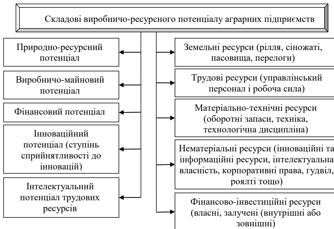
Рис. 1. Структурні компонентами виробничо-ресурсного потенціалу аграрних підприємств.

– фінансово-інвестиційні ресурси – це сукупність грошових надходжень та прибутків, які є в розпорядженні підприємств для здійснення та виконання фінансових зобов'язань.