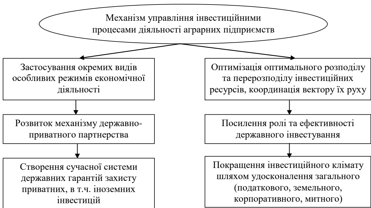
Рис. 1. Механізм управління інвестиційними процесами діяльності аграрних підприємств

Основним напрямом державного регулювання інвестиційної політики України для аграрної сфери має бути визначення пріоритетних галузей виробництва, тобто об'єктів першочергового іноземного інвестування. Одним з провідних критеріїв доцільності такого вибору повинна бути можливість досягти ланцюгової реакції господарської активності та зростання в усій аграрній сфері як наслідку первинної ін'єкції капіталів. Залучення як вітчизняних, так й іноземних інвестицій залишається на сьогодні актуальним у розв'язанні першочергових завдань зростання економіки і є важливою складовою його входження до світових господарських зв'язків.